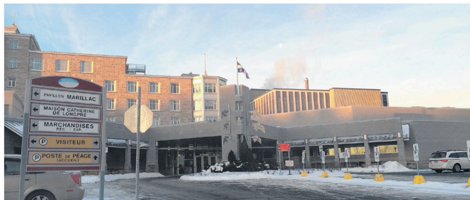
Le service des petits déjeuners sera maintenu à l'Hôpital Saint-Georges.