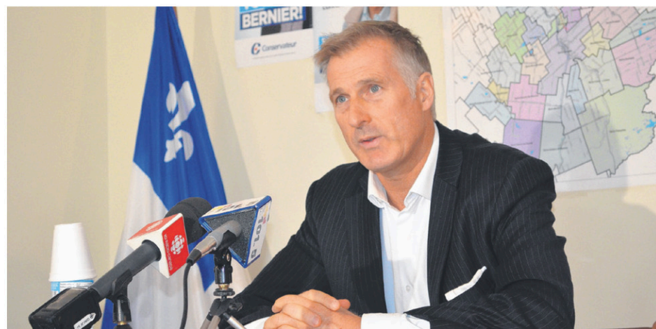
Maxime Bernier veut notamment recentrer les critères des programmes d'aide internationale.

«Nous n'allons pas essayer de plaire à l'establishment bureaucratique et aux Nations Unies, une organisation dysfonctionnelle qui concentre de manière disproportionnée ses activités sur la condamnation d'Israël comme s'il était la source de la plupart des conflits dans le monde», conclut-il.