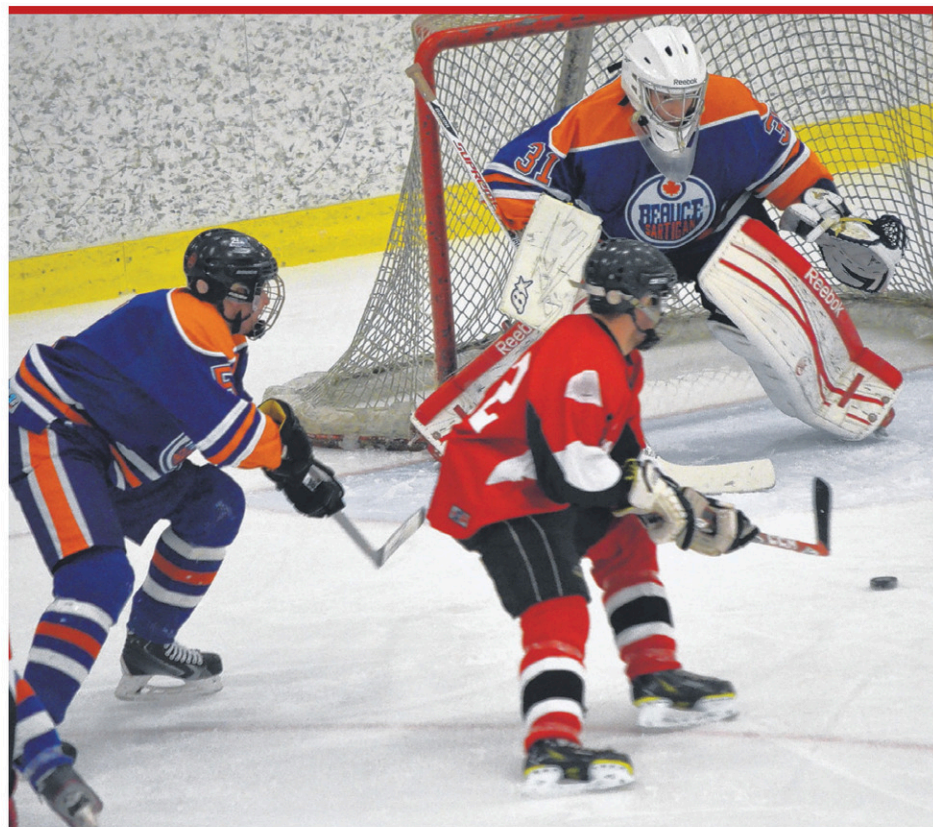
Un total de 70 rencontres seront présentées sur quatre jours.