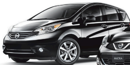
Versa Note 2016

Pendant le Salon de l'auto de Montréal, à la location ou au financement par l'entremise de NCF, pour les Versa Note, Micra et Sentra 2016 .