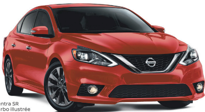
Sentra SR Turbo illustrée