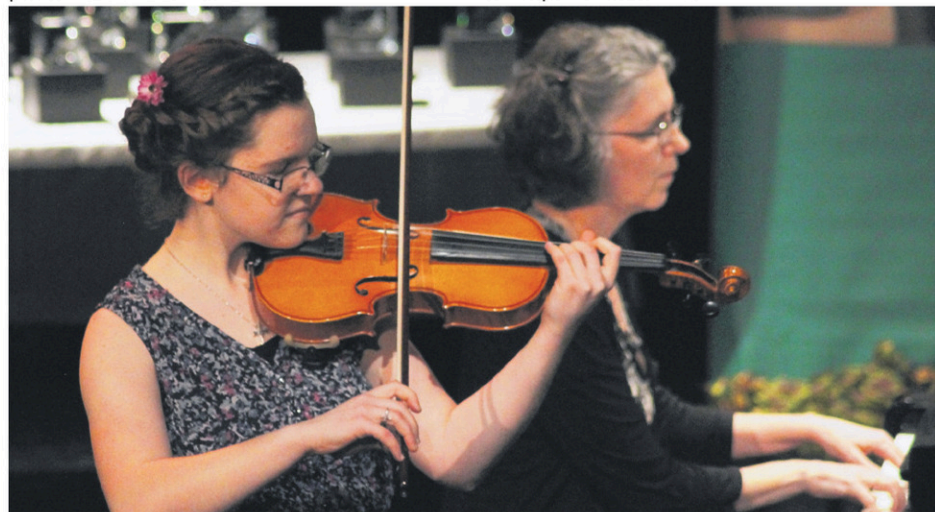
Le concours musical est ouvert aux musiciens de 21 ans et moins.