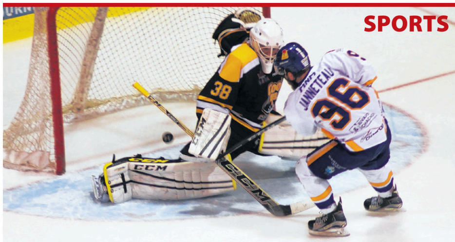
Jérémie Janneteau de Laval a jeté une douche d'eau froide sur les partisans avec le cinquième but du match samedi.