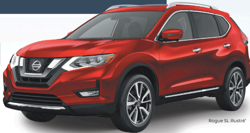
Rogue SL illustré

C'EST COMME PAYER 59 $ ** / SEMAINE pour le Rogue S 2017 à traction avant