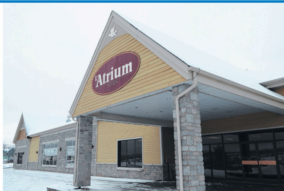
La résidence L'Atrium héberge des personnes en perte d'autonomie modérée à sévère.