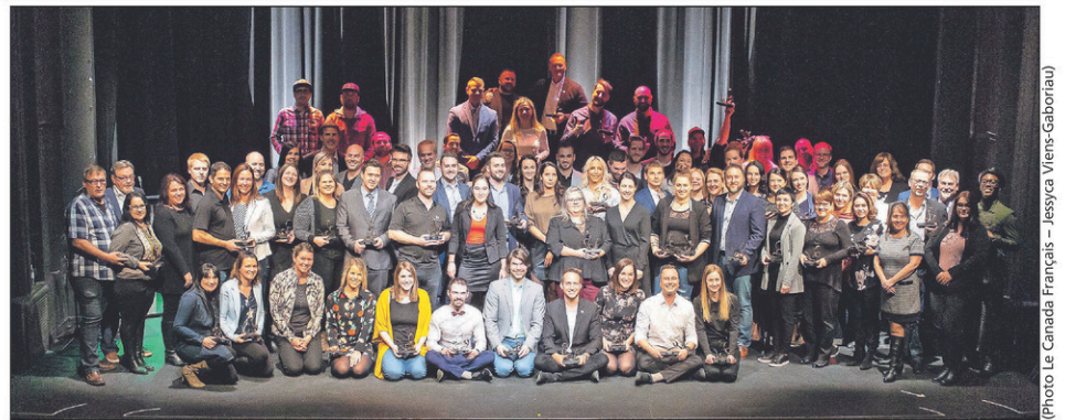
Soixante et un finalistes sont en lice pour l'un des 17 prix du Gala de l'Excellence de la Chambre de commerce et de l'industrie du Haut-Richelieu.

Isolation Anacam et Philippe Denicourt Électrique sont en compétition dans