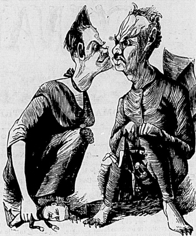
LE DIABLE ET SA FEMME.