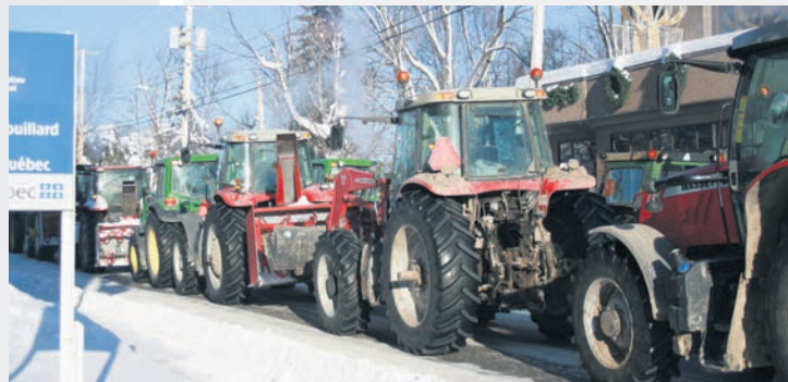
SAGUENAY-LAC SAINT-JEAN — Bravant le froid, deux cents producteurs se sont donné rendez-vous le 19 décembre devant les bureaux du premier ministre Philippe Couillard pour exprimer leur mécontentement.