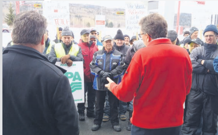
BAS SAINT-LAURENT — Plus de deux cents producteurs agricoles et forestiers se sont rendus le 20 janvier dernier devant les bureaux du ministre de la région, Jean D'Amour, pour dénoncer la réforme du PCTFA.

Pour suivre de près l'actualité liée au développement de ce dossier, consultez la page Web Nous devons agir! sur le site de l'Union au www.upa.qc.ca .