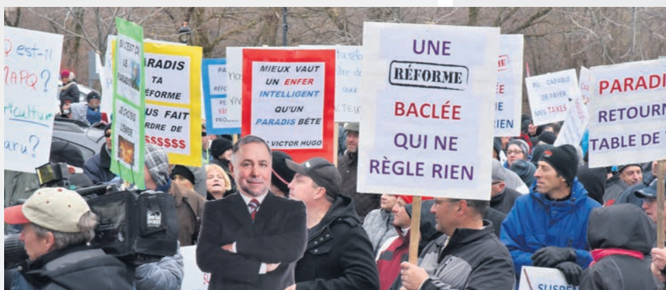
Des centaines d'agriculteurs ont manifesté le 11 novembre devant les bureaux du ministre Pierre Paradis, à Cowansville.