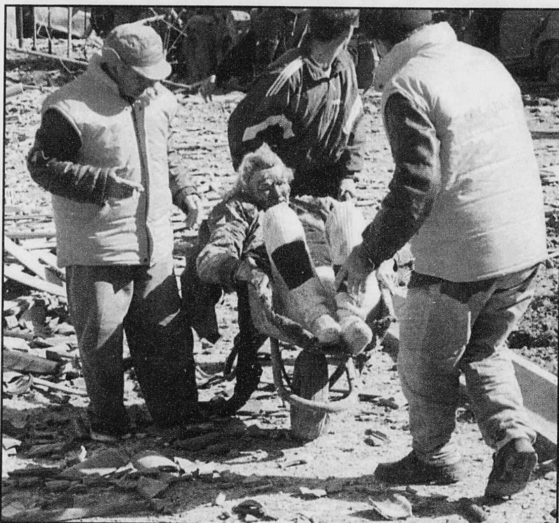
Des aides paramédicales yougoslaves transportent un paysan blessé lors de l'attaque d'un convoi de réfugiés, dans le sud du Kosovo. Le Pentagone a indiqué qu'une enquête avait été ouverte sur l'incident.