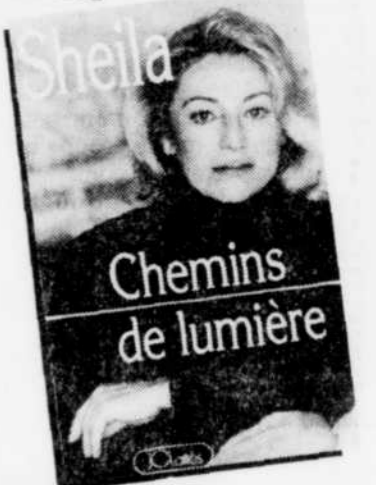
CHEMIN DE LUMIÈRE, Sheila, JC Lattès, 251 pages.

Vous rappelez-vous de la chanteuse Sheila ? Cette dernière vient d'écrire Chemins de lumière aux éditions JC Lattès. Celle qui occupait une place enviable au firmament des vedettes de la chanson populaire au cours des années 60 et 70, propose un véritable témoignage de sa foi et de son engagement spirituel dans ce livre qui raconte également son cheminement de carrière, ses joies et ses peines.