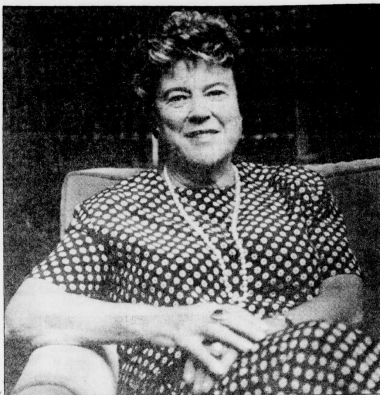
La juge Claire L'Heureux-Dubé ne s'accorde en moyenne que quatre heures de vrai sommeil par nuit.

MONTREAL (PC) — Claire L'Heureux-Dubé arpente joyeusement l'étage qui abrite les bureaux des neuf juges de la Cour suprême du Canada. Vivante, riieuse, animée, un tantinet espiègle, elle est souvent épiée par d'anciens juges en chef impassibles, figés dans leur cadre doré.