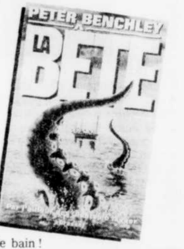
LA BÊTE, Peter Benchley, Grasset, 318 pages.

Il ne s'agit pas ici d'une vedette exécrable ou du prince charmant héros de Walt Disney transformé en bête, mais bien d'un calmar géant. Et vive la peur par le gigantisme! Après les dinosaures, un calmar géant et puant! Si je vous en parle, c'est que son auteur est célèbre. Il s'agit de Peter Benchley à qui l'on doit Les dents de la mer . Parions qu'après le requin, son calmar fera aussi carrière au cinéma! On n'a pas fini de trembler lorsqu'une algue frôlera notre costume de bain!