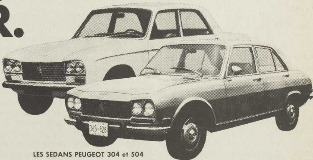
LES SEDANS PEUGEOT 304 et 504

VOYEZ LE CONCESSIONNAIRE LE PLUS PRES DE CHEZ VOUS.