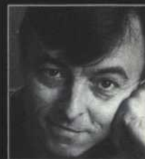
ROBERT LALONDE Le diplomate