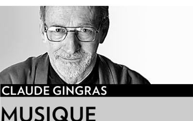
CLAUDE GINGRAS MUSIQUE

Nos deux orchestres de chambre rivaux, l'Orchestre de chambre McGill, que dirige Boris Brott, et I Musici de Montréal, dirigé par son fondateur Yuli Turovsky, se produisent cette semaine dans la même salle Maisonneuve de la PdA, à 24 heures d'intervalle, avec deux pianistes comme solistes.