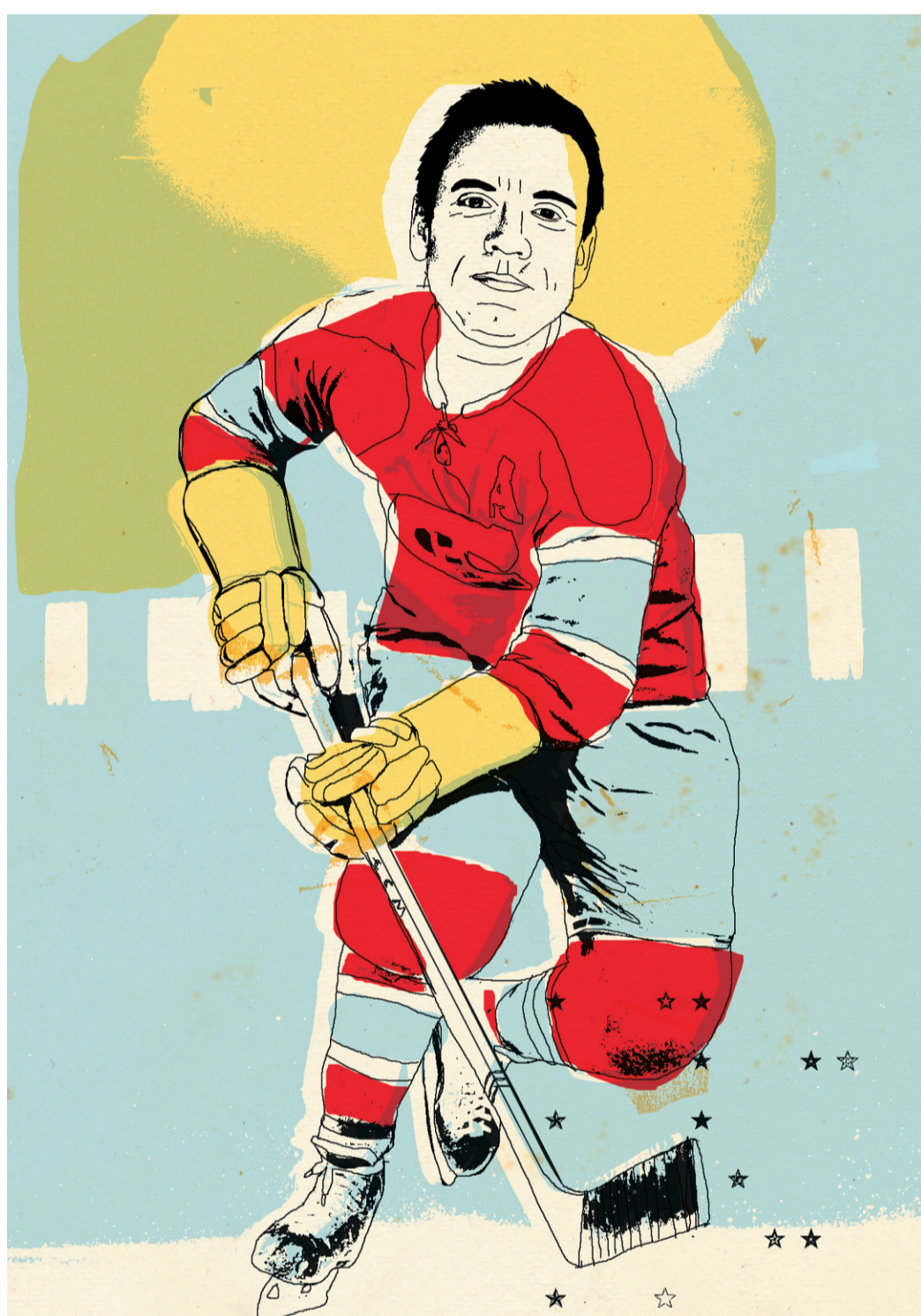
ILLUSTRATION FRANCIS LÉVEILLÉE, LA PRESSE