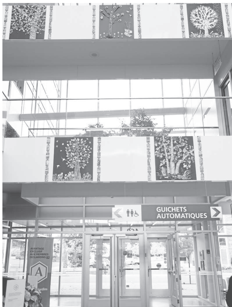
Une vingtaine d'œuvres remplies de détails occupent l'atrium du Carrefour de la coopération, transformé jusqu'en octobre en salle d'exposition.