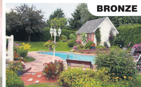
478 Allée des Hauts-Bois: Lise Alix