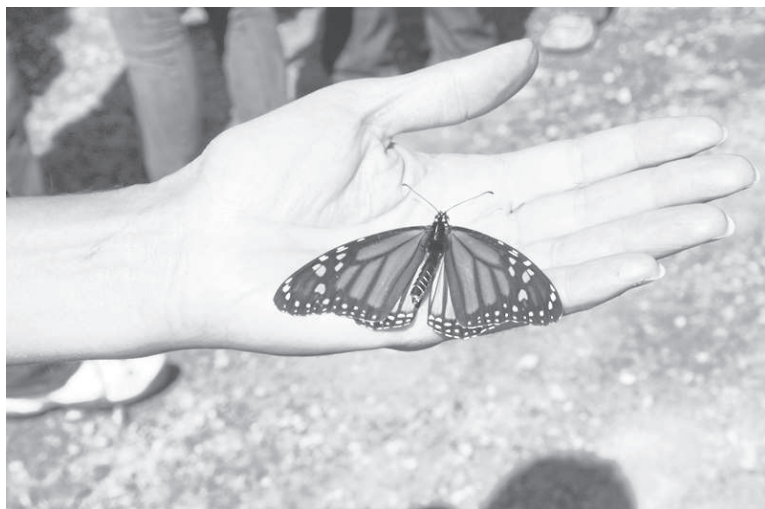
Le monarque sera célébré sous toutes ses formes les 12 et 13 septembre au CINLB.

Pour adopter vos papillons pour l'étude Monarch Watch ou pour toute information : 450-365-3861 ou le www.cinlb.org