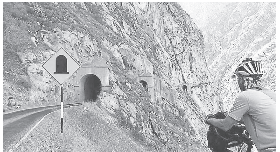
À l'assaut des 35 tunnels dans le canyon del Pato.