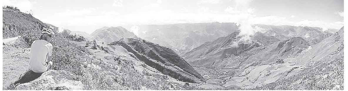
Une petite pause dans les Andes péruviennes.

C'est bien connu, l'Amérique du Sud offre d'innombrables contrastes, tant au niveau des paysages que des écarts de température en haute altitude. Après avoir sillonné des contrées sous une chaleur accablante, quoi de mieux pour deux Québécois que de renouer avec... la neige! Après avoir célébré le 14 000 e kilomètre de leur odyssee de deux ans, un épais tapis blanc attendait les cyclistes alors qu'ils atteignaient 4700 mètres d'altitude dans le parc national de Huascarán, portant le nom du plus haut sommet péruvien. Après une ascension sous un radieux soleil, un déferlant grésil a forcé le tandem à s'abriter