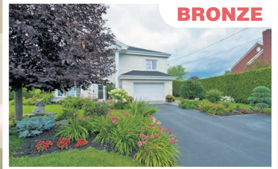
1043, rue St-Charles Sud : Maude Charbonneau-Hébert