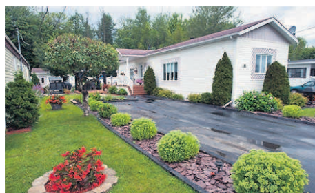
1633-11, rue Principale : Manon Désormeaux et Stéphane Sorrant