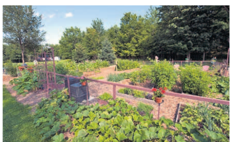
862, chemin Deslauriers: Lucie Deslandes