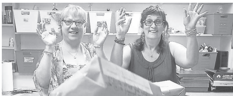
Cette mise en scène visait à faire tomber les préjugés sur l'analphabétisme.

l'alphabétisation et faire tomber les tabous liés à l'analphabétisme sont les deux mandats que souhaite remplir le Sac à Mots. En conférence de presse, mardi, en pleine Journée internationale de l'alphabétisation, les gens du Sac à Mots ont invité les gens présents à construire et à détruire un mur (fait de boîtes de carton) de préjugés. La mise en scène se voulait une activité participative dans le but de faire prendre conscience aux