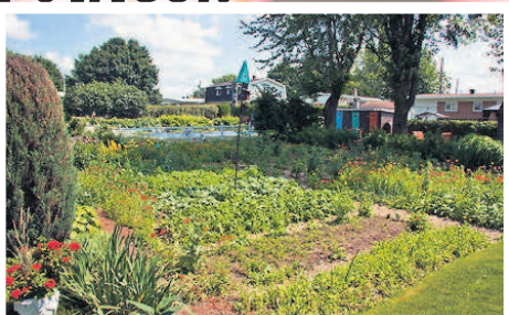
81 de Toulouse: Pauline Bouchard et Gilles Provençal