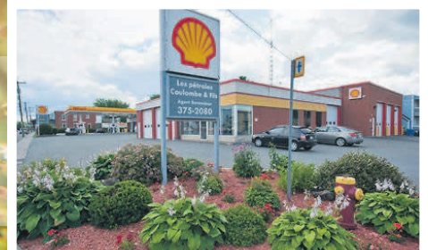
236-238, rue Robinson Sud : Coulombe et Fils inc. • 224, rue Robinson Sud : Shell Boni-Soir