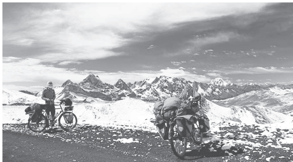
Après des kilomètres sous une chaleur accablante, les cyclistes ont repris la route sous un tapis blanc.

Aux dernières nouvelles, le duo poursuivait sa route près de Quito, la capitale équatorienne, à proximité du volcan Cotopaxi.