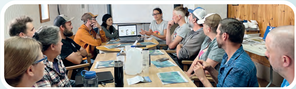
Lieu Ferme JMS Amitiés, hôte de notre première activité.

Le Comité du bassin versant de la rivière du Lièvre (COBALI) collabore avec la MRC d'Antoine-Labelle afin de rassembler des producteurs agricoles souhaitant innover et échanger pour mettre en place des pratiques agroenvironnementales dont le but est de diminuer les pertes de sol vers les cours d'eau tout en améliorant les habitats fauniques et floristiques sur les terres. Parmi ces pratiques, on retrouve entre autres :