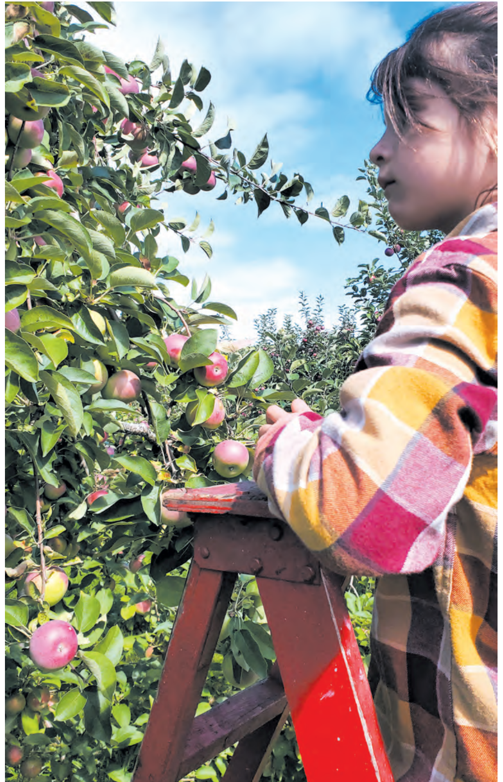
2024 aura été une année record pour les producteurs et productrices de pommes du Québec ainsi que pour les consommateurs.

Il faut patienter entre 3 et 4 ans avant qu'un pommier commence à produire ses premières pommes, un véritable témoignage de la patience et de la passion de nos producteurs et productrices.