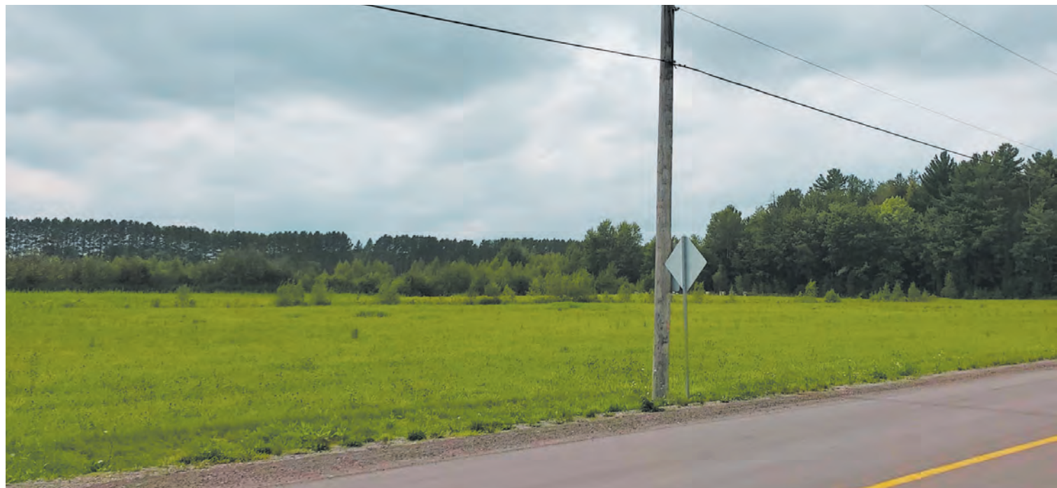
Laurent Barré fut cultivateur, syndicaliste, romancier et ministre de l'Agriculture. La quantification des terres en friches reste vaporeuse, surtout dans la région des Laurentides et celle de l'Outaouais.

Ces zones en transition se démembrer aussi en différents types : des friches herbacées, où les herbes prédominent, des friches arbustives, où les arbustes