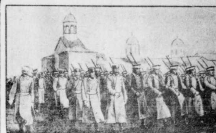
LE PRINCE HERITIER DE SERBIE A LA TETE DE SON REGIMENT.

La Turquie avait réuni la l'élite de ses généraux et de ses troupes. L'ARMÉE SERBE SUBIT UN TRES GRAVE ECHEC Les Bulgares concentrent leurs forces autour d'Andrinople: combat terrible.