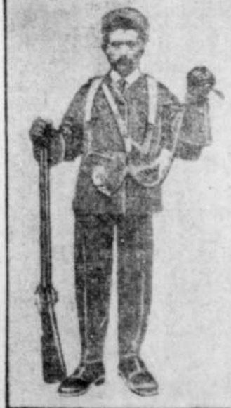
L'infortuné chasseur trouvé mort dans une cabane, au milieu de la forêt, à neuf milles de Notre-Dame des Anges.