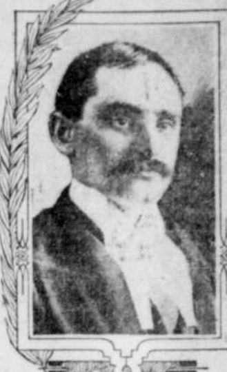
M. P.-J.-ARTHUR CARDIN, avocat de Sorel, réélu député de Richelieu aux Communes du Canada.