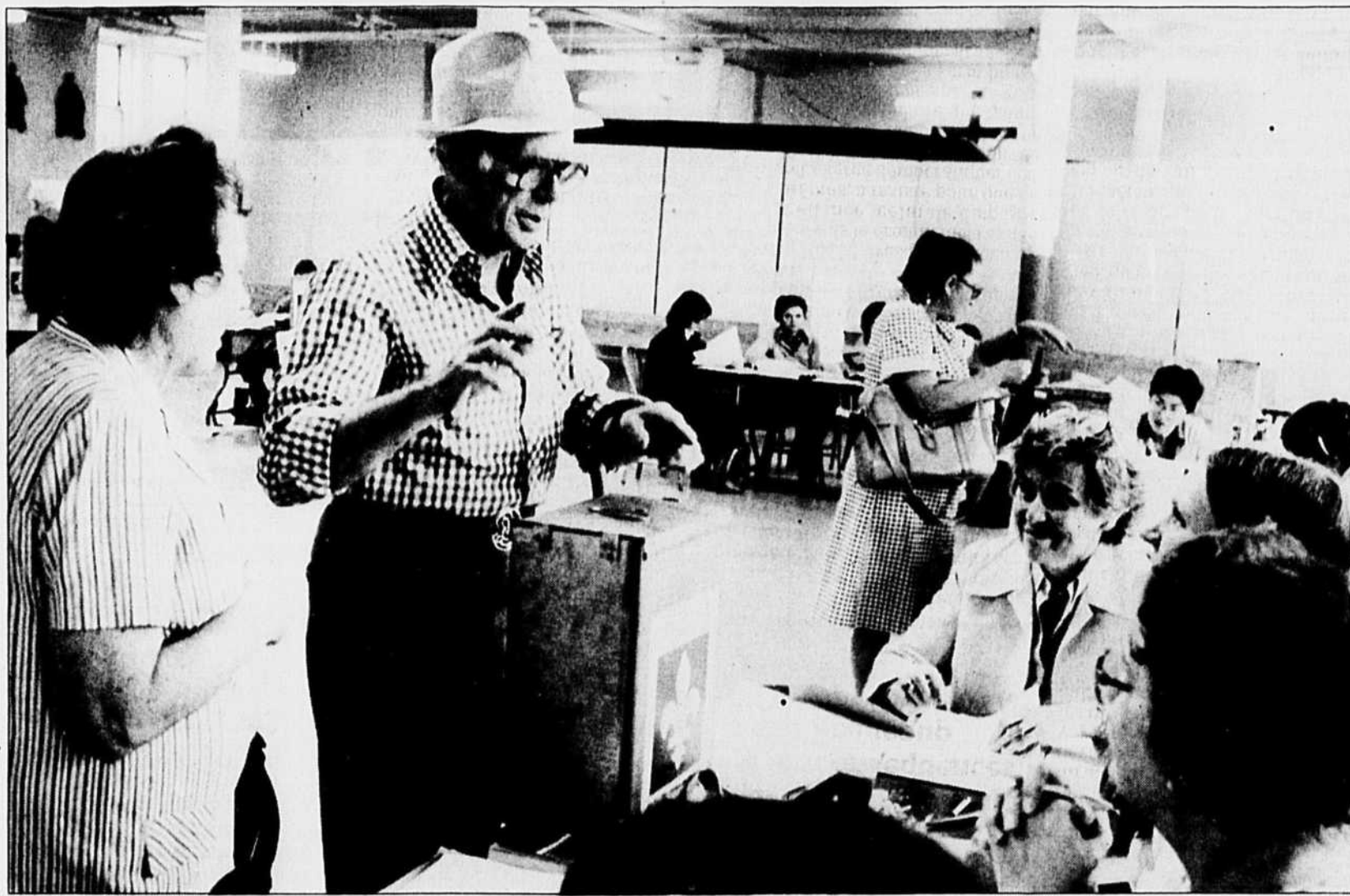
Le vote lors du référendum de 1980.

Par ailleurs, M. Lévesque était très conscient du fait que s'il voulait que l'ensemble de ses concitoyens viennent à partager ses valeurs démocratiques, il fallait transformer profondément toute une série de manières de faire qui dévalorisaient l'État et les processus démocratiques et qui empêchaient qu'on leur fit confiance. Il fallait créer les conditions favorables à l'émergence de valeurs nouvelles qui deviendraient l'assise d'une nouvelle façon de concevoir la société. Cette révolution tranquille des attitudes et des mentalités n'était possible que si on réussissait à réformer la façon suivant laquelle la société québécoise s'était jusqu'alors gouvernée. Vaste programme qui se traduisit par toute