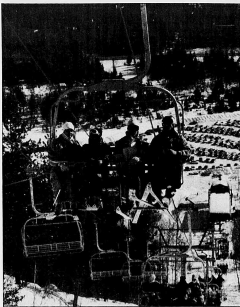
Plus de 6 millions ont été investis au cours des deux dernières années à Val Saint-Côme.