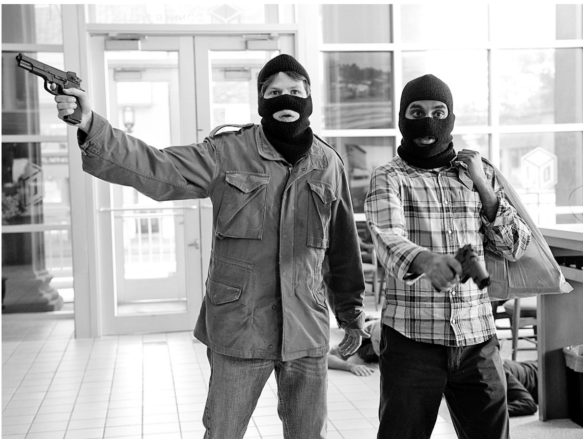
Jesse Eisenberg et Aziz Ansari tiennent la vedette dans la comédie 30 Minutes Or Less .

AMC Forum 12h40, 18h05 Cavendish V-S-D-Ma 13h00, 15h50, 18h50, 21h00, L-Me-J 15h50, 18h50, 21h00 Cinéplex Odéon Brossard V-S-D-L-Ma-J 13h00, 15h30, Me 13h30, 16h00 Colossus Laval 12h05, 14h35, 17h05, 19h35, 22h05 Des Sources 12h50, 15h00, 17h10, 19h20, 21h30, V-S 23h40 Méga-Plex Lacordaire V-L-Ma-Me-J 13h00, 15h10, 17h20, 19h30, 21h40, S-D 10h30, 13h00, 15h10, 17h20, 19h30, 21h40 Méga-Plex Marché Central V-L-Ma-Me-J 13h05, 15h15, 17h25,