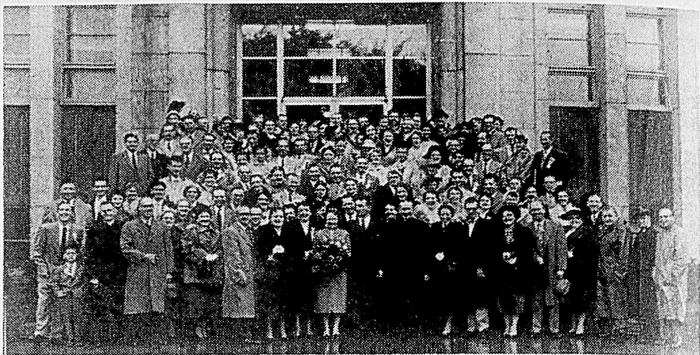
A L'HOTEL DE VILLE.—Près de 250 congressistes ont assisté en fin de semaine au congrès de la Fédération patronale des barbiers et coiffeurs de la Province de Québec. On remarquera sur cette photo une partie des congressistes à la porte de l'Hôtel de Ville.

SYSTEME DE CHAUFFAGE DEFECTUEUX. Il s'agit, ici, de tout système qui sert à chauffer un édifice et, nullement, de ce qui sert à certains procédés spéciaux. Tout outillage de chauffage doit être toujours bien entretenu et bien propre. Une personne qualifiée, soit un employé ou un homme de service de l'extérieur doit procéder régulièrement à son inspection.