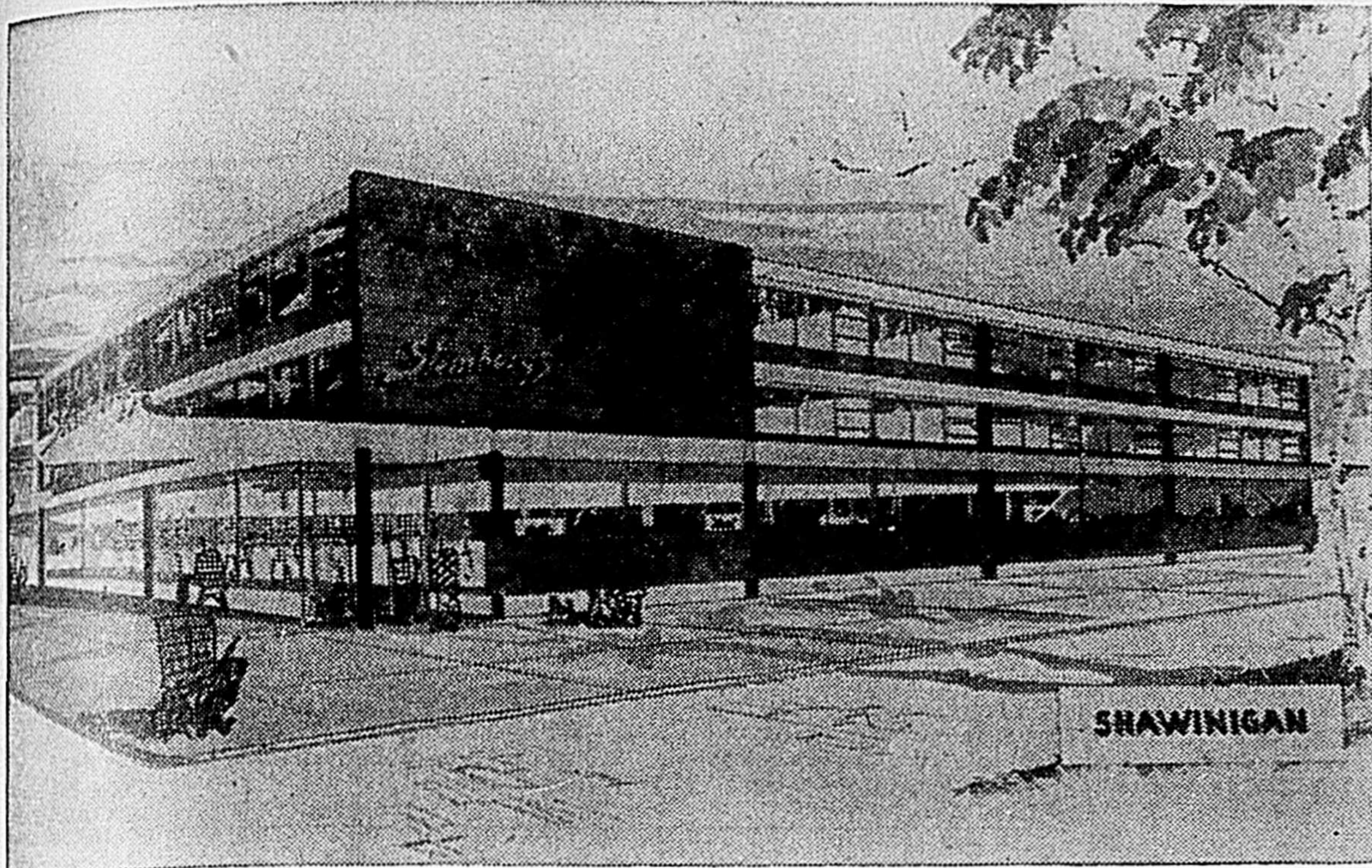
Un nouveau marché Steinberg's à Shawinigan ouvrira ses portes au public en novembre prochain. Ce marché est situé à l'angle des rues Station et Cinquième Rue.