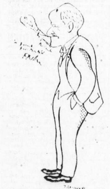
Caricature de Sennep, avec autographe de Franc-Nohain, pour le «Devoir».

d'autres personnes; dans un de ses articles de l'«ECHO de Paris», il a répété à plusieurs reprises: — Nous avons emmené nos enfants. Ce sont eux qui vont assurer la survivance des relations du Canada français avec la France. Etant venus jeunes, ils reviendront plus vieux. Nous retrouvons dans son premier article de l'«ECHO de Paris» sur le Canada les phrases significatives suivantes, qui laissent bien croire que M. Franc-Nohain présentait sa mort: «Il était excellent que tant de jeunesse se soit mêlée aux personnalités officielles qui avaient été délégués à ces fêtes; il est excellent que tant d'entre nous aient profité de cette croisière et des vacances pour emmener leurs fils ou leurs filles. D'abord, parce que la délégation y gagnait en grâce et en bonne grâce, et le voyage en gaieté. Mais surtout parce qu'il faut que nos enfants se souviennent, qui nous ont destinés, Dieu merci, à se soulever plus longtemps que nous». Et plus loin, il écrit encore en commentant un incident, relatif à son âge: «De combien d'années, maintenant et même en comptant largement, ma vie a-t-elle été faite? Heureux les frais regards qui se sont posés sur ces scènes, les jeunes cerveaux qui en conserveront les images et auront tout loisir de les méditer longtemps, pour le plus grand bien, dans l'avenir, du Canada et de la France».