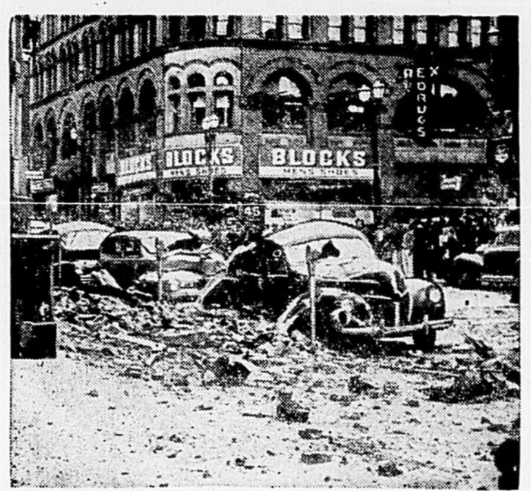
• SUR LE PASSAGE DU TREMBLEMENT DE TERRE. — Voici une photo prise à Seattle après le tremblement de terre qui a secoué la côte du Pacifique, récemment, depuis Victoria jusqu'à l'Oregon. Seattle a été la ville la plus durement frappée, mais les grondements sourds accompagnant les secousses sismiques se sont fait entendre jusqu'en Colombie Britannique.