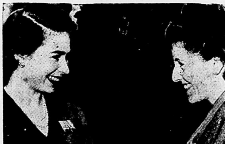
• La Princesse Elizabeth cause avec un ex-membre des Services Armés, lors d'une réunion du Service Auxiliaire Territorial, au Royal Albert Hall, à Londres, récemment. La Princesse, qui a servi avec le HMS durant la Grande Guerre II, renoua d'anciennes amitiés, sous le travail des anciennes combattantes et leur demanda de se tenir prêtes à toute éventualité.