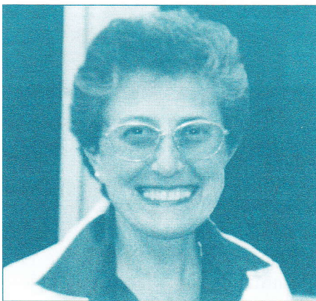
Ivone Gebara théologienne brésilienne

La jonction des mot écologie et féminisme a produit le terme écoféminisme. Ce mot à caractère positif est né de deux situations négatives: la destruction du monde naturel ou des écosystèmes et l'oppression des femmes dans nos sociétés patriarcales. Cette double réalité provoque les personnes qui travaillent dans la perspective écoféministe non seulement à changer les rapports inégalitaires entre les femmes et les hommes, mais aussi à transformer les rapports de conquête, de destruction et de mépris en relation avec le « monde naturel » considéré comme objet d'usage et de profit.