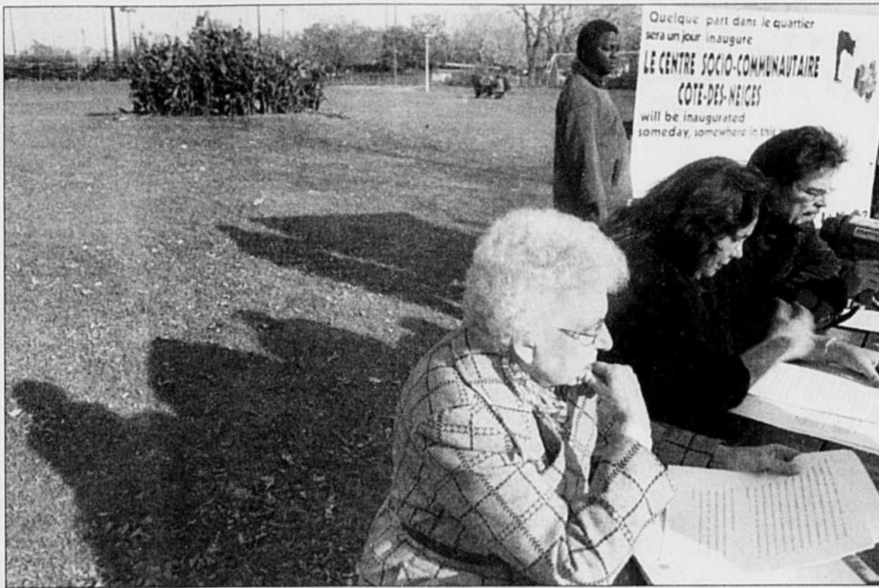
Les citoyens du quartier Côte-des-Neiges se sont réunis, hier, pour «inaugurer» le centre sociocommunautaire qui leur a été promis plusieurs fois en dix ans et qu'ils attendent toujours...

En mai, une série de manifestations s'étaient tenues à Montréal, à Québec, à Jonquière et à Rouyn, au cours desquelles 5000 employés à pourboires s'étaient retrouvés dans la rue. Faut-il faire un geste d'éclat, se demande Claude Dufour, pour que le problème soit réglé dans une transition réaliste?