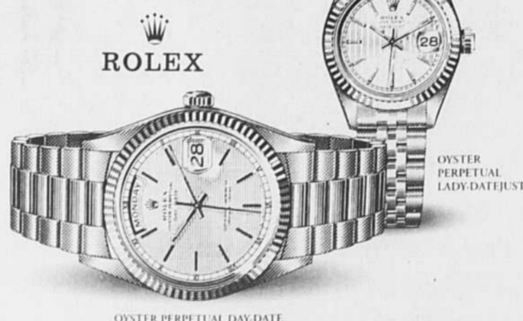
OYSTER PERPETUAL DAY-DATE

Chaque Rolex Oyster qui porte l'inscription «SUPERLATIVE CHRONOMETER OFFICIALLY CERTIFIED» a survécu à 15 jours et 15 nuits d'épreuves imposées par le Contrôle Officiel Suisse des Chronomètres.