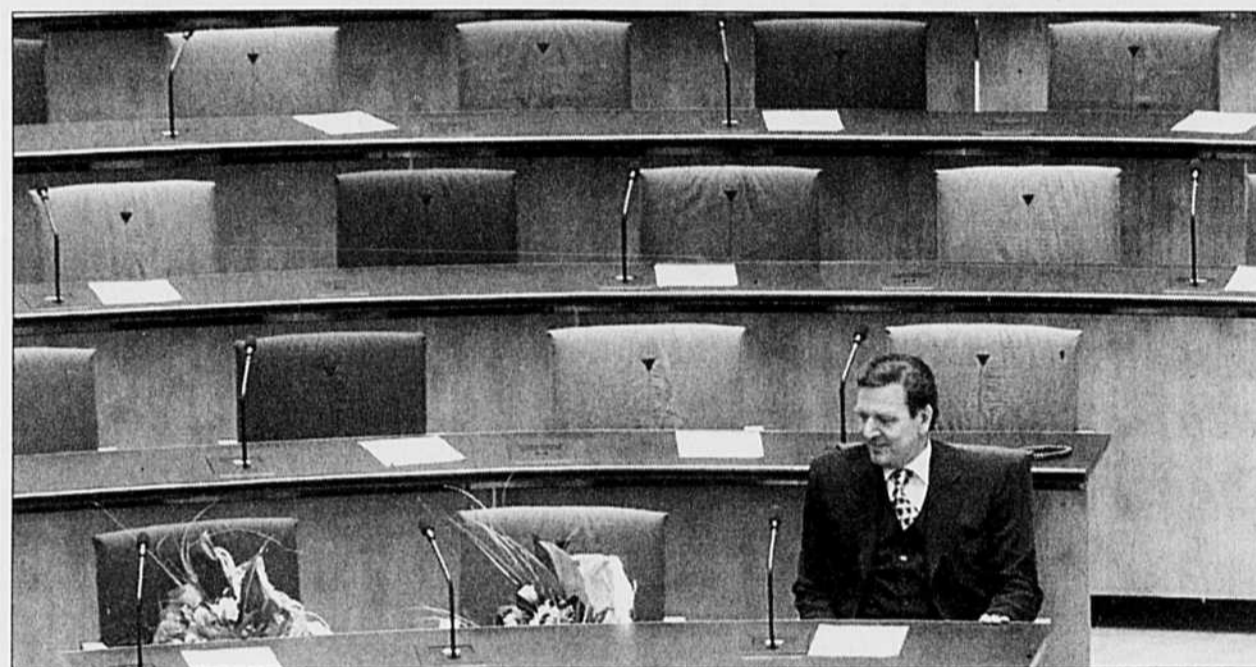
LE SOCIAL DÉMOCRATE Gerhard Schroeder a pris place sur le fauteuil du chancelier peu après son entrée officielle au parlement, hier. Schroeder, le septième chancelier en Allemagne depuis la fin de la guerre, veut créer un «nouveau début» pour son pays.

Pour sa part, le chef de l'Opposition officielle, Preston Manning, a dit souhaiter que le premier ministre affiche clairement ses couleurs en reconnaissant «le besoin d'une réforme fondamentale du fédéralisme.»