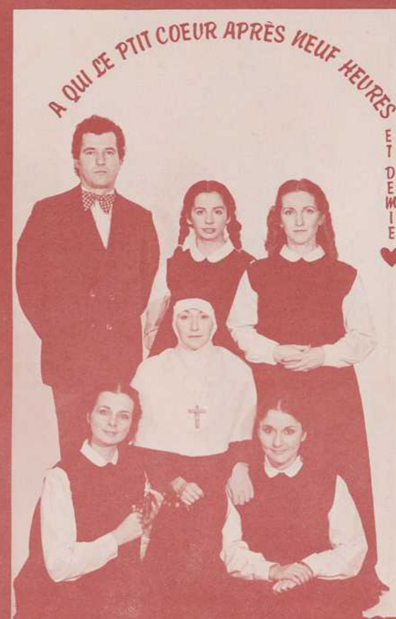
UNE PIÈCE DE MARYSE PELLETIER