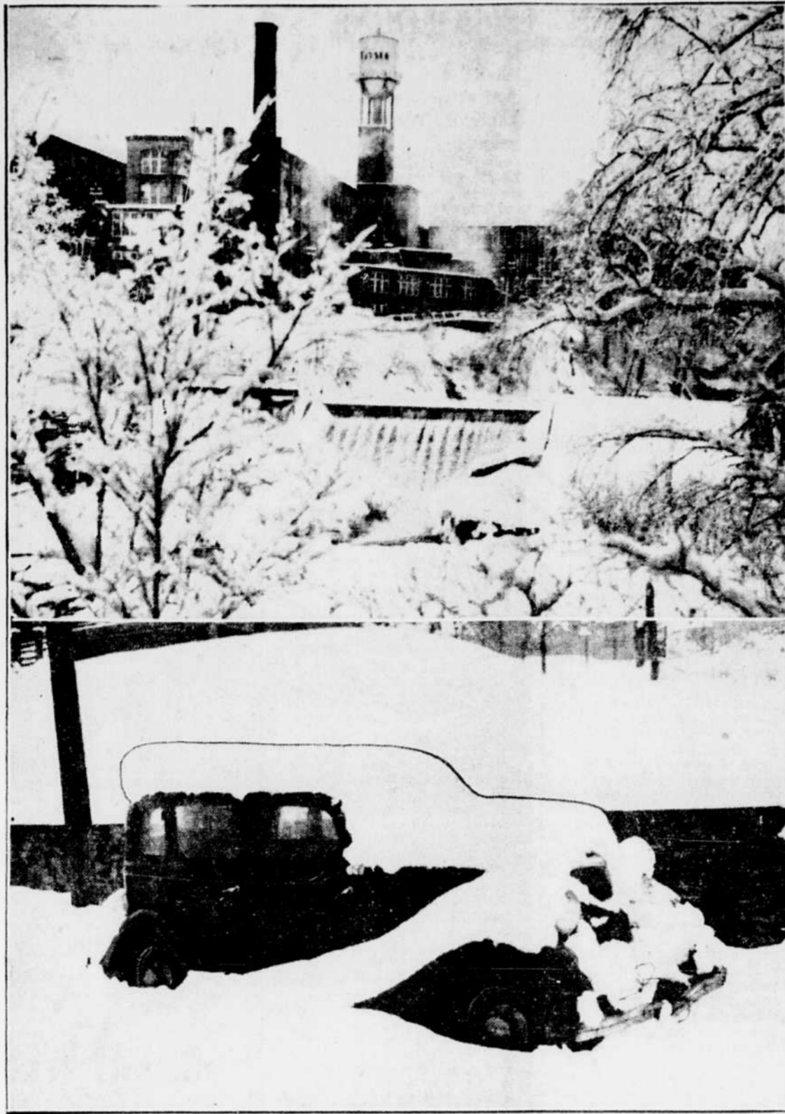
Ces photographies ont été prises aux premières heures de la Journée à Sherbrooke hier. La photo du haut fait voir la chute de la neige de la rivière Magog en arrière de l'édifice de la "Tribune", avec, à l'arrière-plan, l'usine de la Julius Kayser. Au bas, une automobile sous la neige.