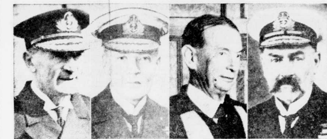
●Ci-dessus quatre des cinq fameux amiraux de la flotte qui ont été rappelés en devoir. Ce sont, de gauche à droite: l'amiral Sir Reginald TYRWHITT, baronnet, connu comme le "mouton noir" de la marine britannique, qui a pris sa retraite en juillet dernier, après 56 ans de service; l'amiral Sir Frederick FIELD, qui commandait le "H.M.S. King George V" à la bataille du Jutland et fut subsequment sous-chef de l'état-major naval, commandant-en-chef de la flotte de la Méditerranée et premier Lord de l'Amirauté; l'amiral Sir Roger KEYES, fameux pour ses raids contre Zeebrugge et Ostende en 1918; et Sir Henry OLIVER, directeur du service d'Intelligence dans l'état-major de guerre de l'Amirauté, en 1914, commandant-en-chef de la Home Fleet et en 1928 amiral de la flotte.