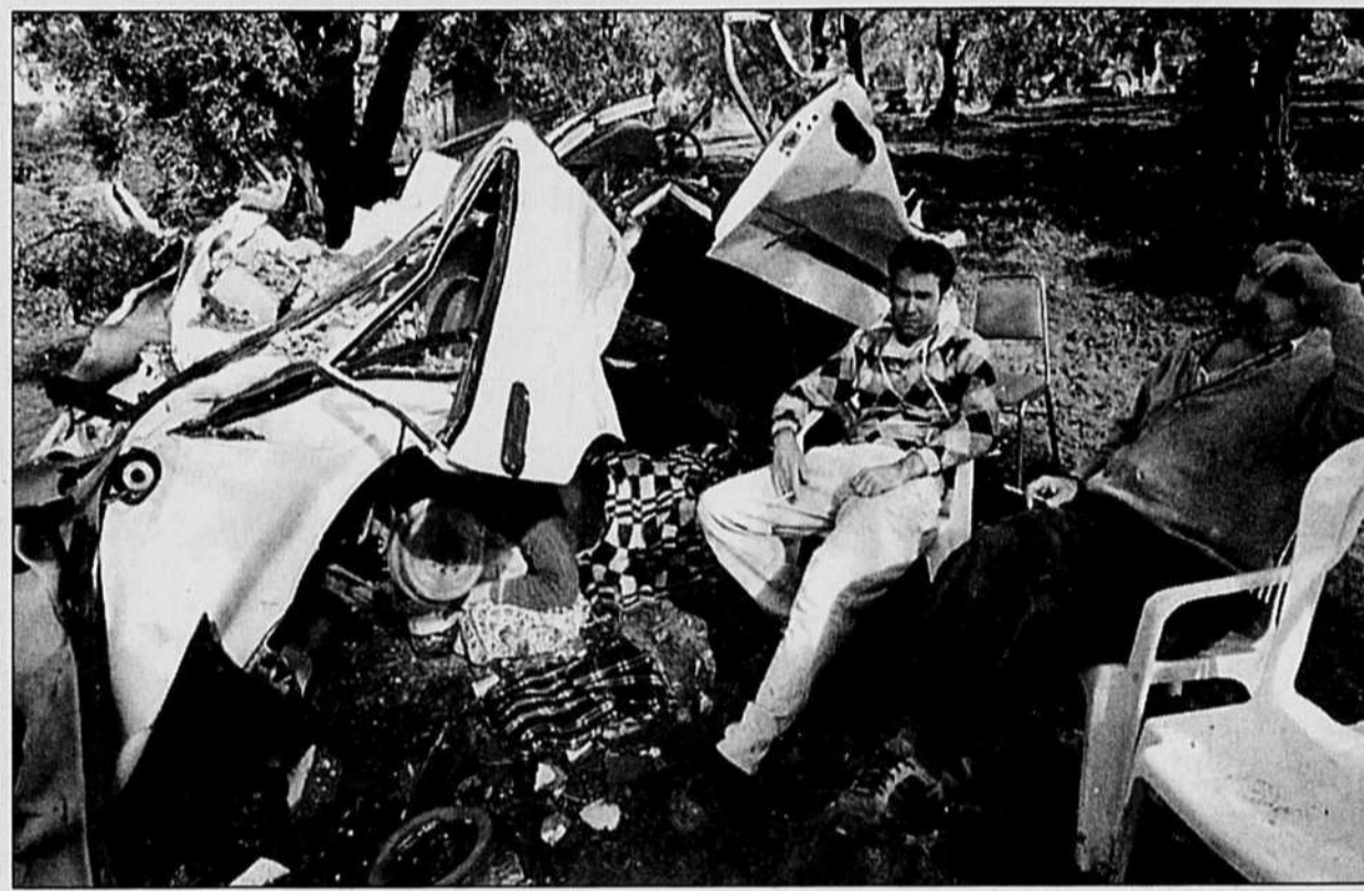
Cette famille turque a élu domicile parmi les restes d'une voiture de ce terrain vague de Cinarcik, une des nombreuses localités turques à avoir été frappées par le tremblement de terre de la semaine dernière qui, aux dernières nouvelles, a fait 13 040 morts et 200 000 réfugiés.

Coincé, le GRI propose d'utiliser les termes «capitale du Québec» et demande de rencontrer Mme Beaudoin.