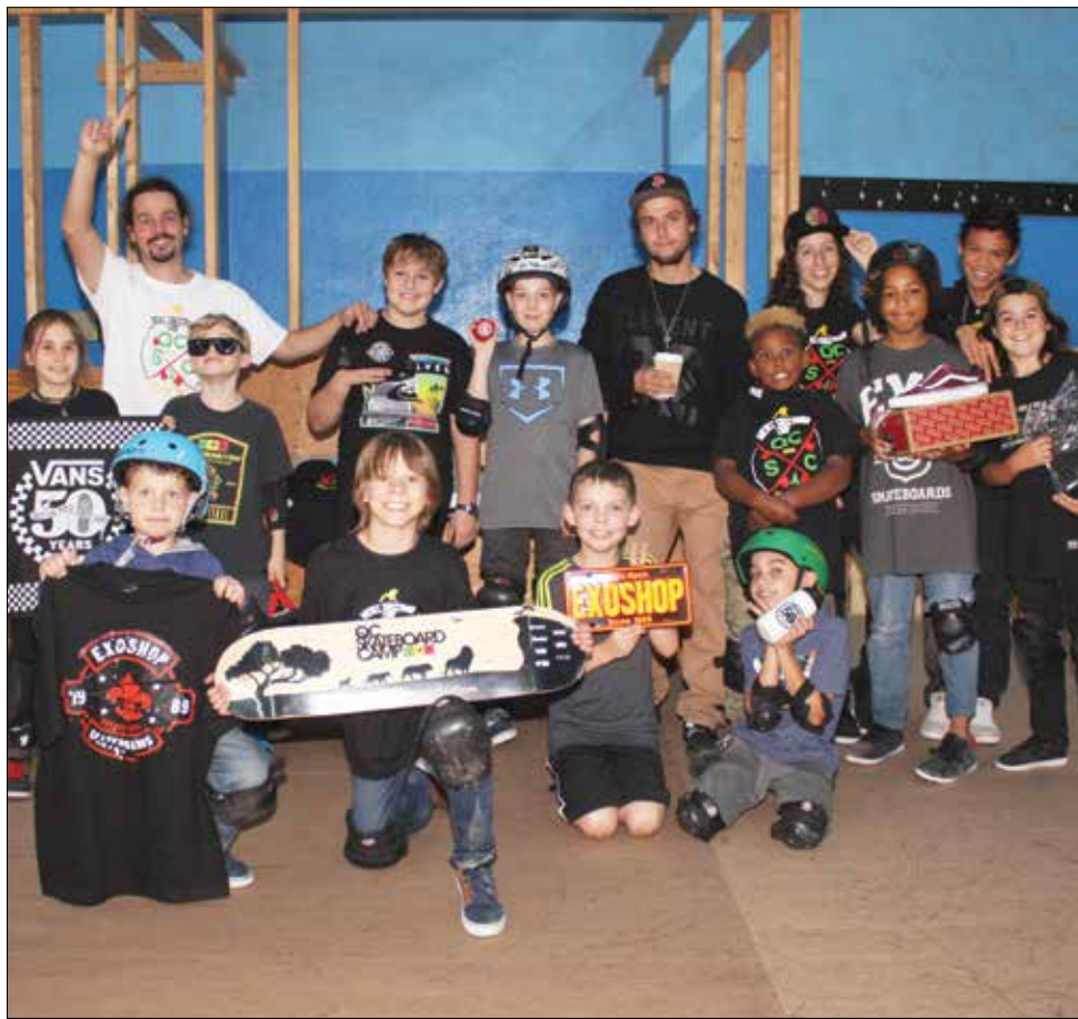
Le premier camp d'hiver spécialisé du Qc.SkateboardCamp a eu lieu récemment.

(YG) Le premier camp d'hiver spécialisé du Qc.SkateboardCamp a eu lieu récemment. Offert au skatepark EXO, c'est le seul camp de skate spécialisé de la grande région de