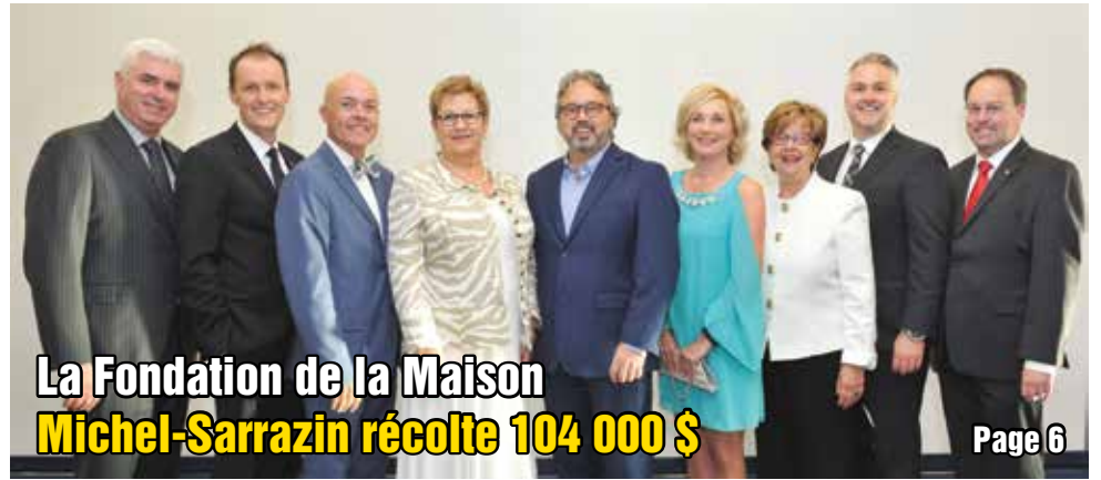
La Fondation de la Maison Michel-Sarrazin récolte 104 000 $