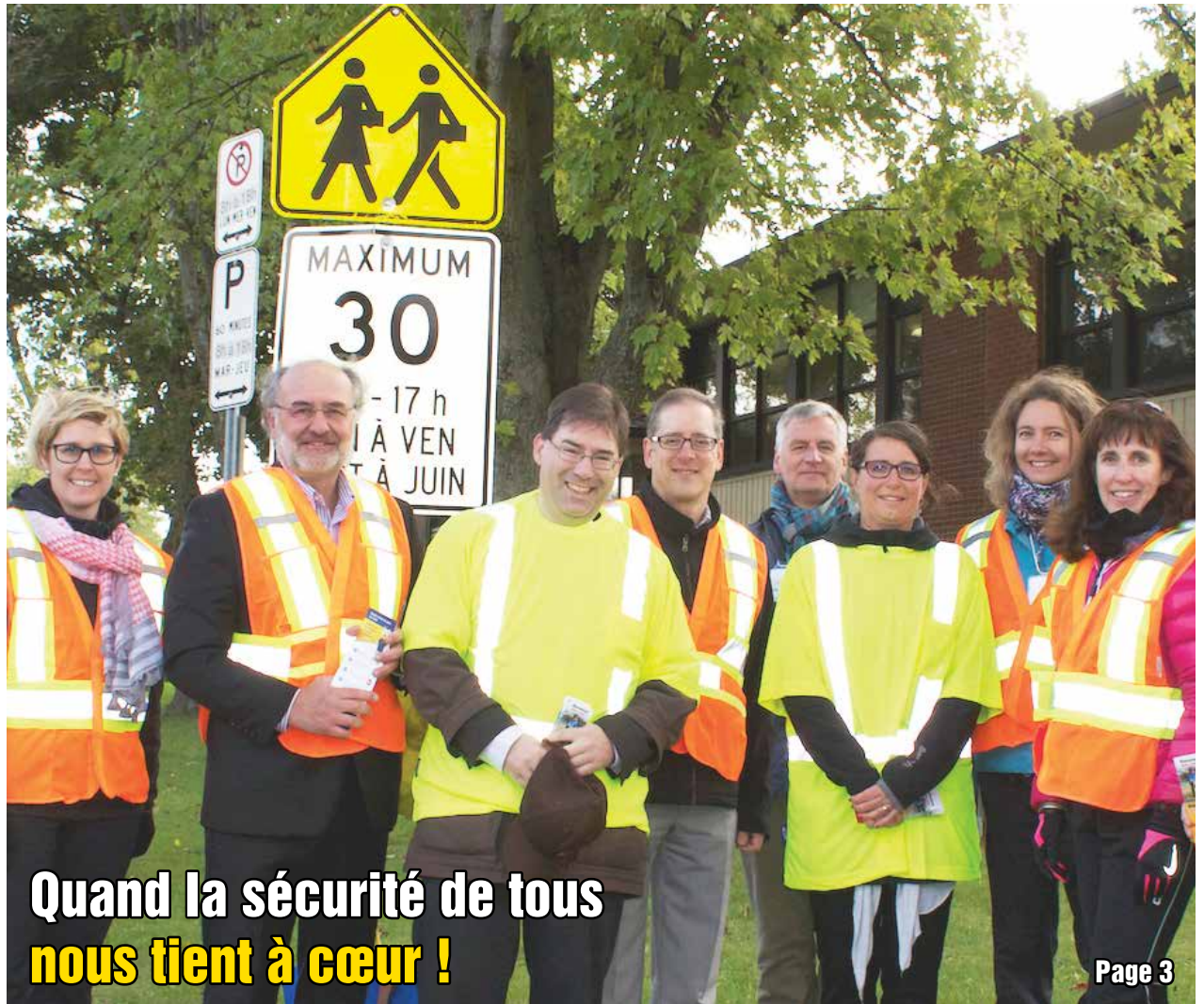
Quand la sécurité de tous nous tient à cœur !