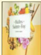
Le nouveau visuel des Halles Sainte-Foy.

Les Halles Sainte-Foy (qui ont récemment fait disparaître le déterminant « de » dans l'appellation!) ont dévoilé et célébré le 29 septembre dernier, sous la thématique Alimenter le plaisir , leur nouvelle identité visuelle, leurs récentes rénovations et une foule d'excitants changements à l'occasion de la rentrée automnale! Fondées en 1982, les Halles Sainte-Foy ont choisi de faire souffler un vent de fraîcheur sur l'entreprise cette année, revitalisant ainsi l'aspect esthétique de l'établissement, l'offre globale des marchands en plus de l'image de marque des Halles. Cette image neuve passe entre autres par un nouveau logo et une nouvelle signature qui revient à l'essence même des Halles : créer des moments agréables autour de délices... une signature visuelle fraîche, saine, vivifiante et appétissante! Ces nombreuses belles annonces et nouveautés complètent l'arrivée récente de nouveaux commerces, tels que Buddha Station et Mme Macadam, et la mise en ligne, prochainement, d'un site Web rafraîchi au hallessaintefoy.ca. Le site proposera entre autres la possibilité de