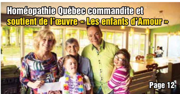
Homéopathie Québec commandite et soutient de l'œuvre « Les enfants d'Amour »