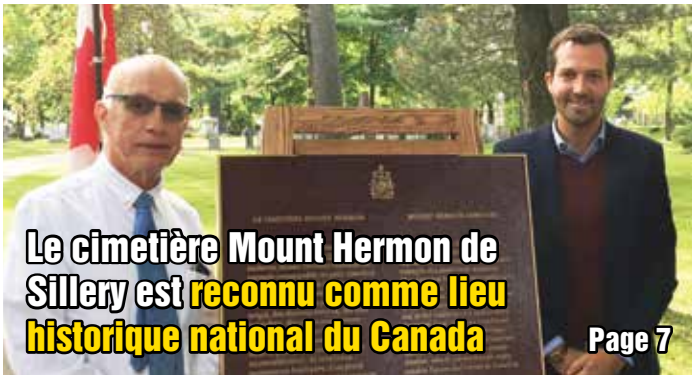
Le cimetière Mount Hermon de Sillery est reconnu comme lieu historique national du Canada