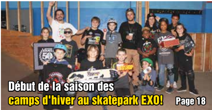
Début de la saison des camps d'hiver au skatepark EXO!