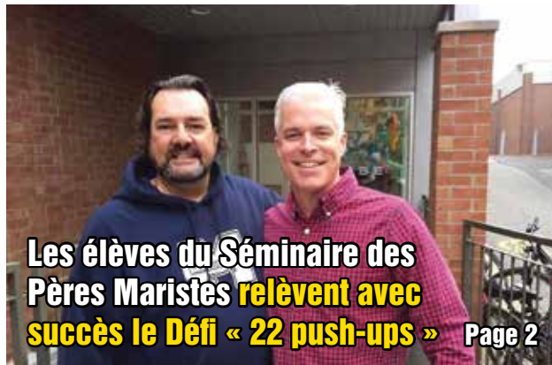
Les élèves du Séminaire des Pères Maristes relèvent avec succès le Défi « 22 push-ups »