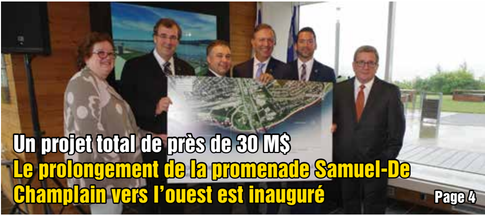
Un projet total de près de 30 M$ Le prolongement de la promenade Samuel-De Champlain vers l'ouest est inauguré