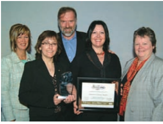
Armoires Cuisine Action Mérite STIQ 2007