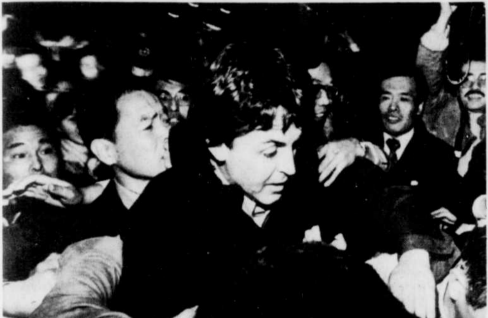
L'ex-Beatle Paul McCartney a dû se frayer difficilement un chemin au milieu d'une foule d'admirateurs et de curieux, hier, alors que des policiers l'escortaient jusqu'aux bâtiments de l'Unité d'enquête sur les drogues de Tokyo où il a été interrogé au sujet de la saisie de mari qui a été faite mercredi dans ses bagages.

Le dernier voyage de McCartney au Japon remonte à 1965. Il était alors avec les Beatles, au sommet de leur succès.