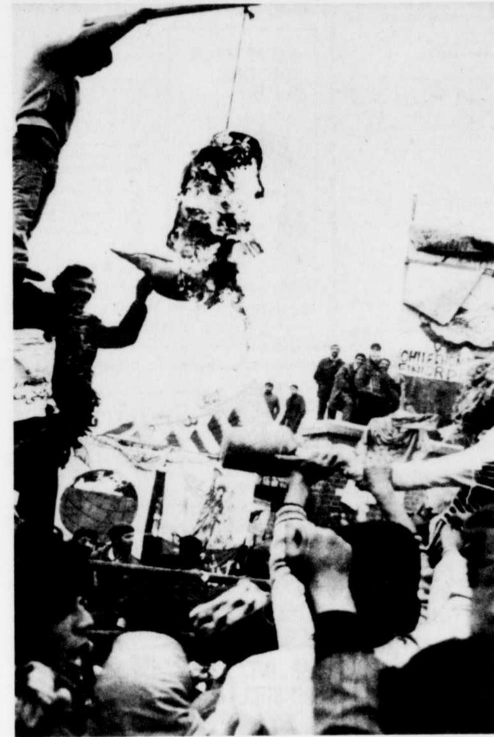
Des manifestants iraniens ont brûlé une effigie de l'ancien chah d'Iran devant l'ambassade des Etats-Unis pour célébrer le premier anniversaire du départ de l'ex-souverain, le 16 janvier 1979.

Le tracé de Trans Mountain est de 1,154 kilomètres, avec une capacité de 500,000 barils, pouvant être portée à 630,000 barils.