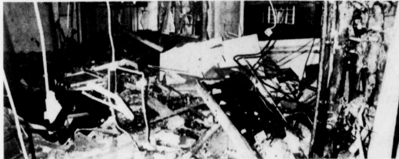
Deux bombes ont explosé hier dans le Royal Court Hotel de Londres, tuant une personne et en blessant plusieurs autres. Un homme, que l'on pense être un terroriste préparant un attentat, a été tué par la première explosion tandis que la 2e bombe a explosé quand les policiers s'apprêtaient à retirer son corps des débris.

Avant ces attentats, des soldats britanniques avaient découvert une "énorme mine" le long d'une route du comté de South Armagh, près de la frontière de l'Eire. L'engin comprenait trois bouteilles de gaz renfermant chacune 50 kilos d'explosif et était relié par un fil à une ferme située de l'autre côté de la frontière. Des artificiers sont parvenus à le désamorcer.