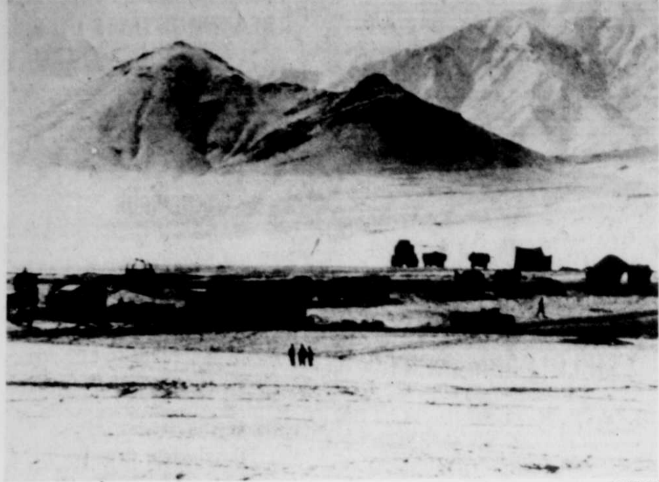
Contre un fond de montagnes enneigées, un camp militaire soviétique au bord d'une route entre Kaboul et le col de Salang. Les journalistes