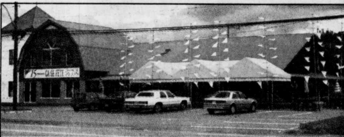
Les halles Pères Nature de Sainte-Marie agrandies et rénovées.

On ne retiendra pas le concept de l'arche dans le cas de l'édifice principal, comme cela représente des difficultés physiques et des coûts trop élevés, mais on trouvera un hall d'entrée de 300 mètres carrés d'une hauteur de quatre étages face au parc Saint-Roch.